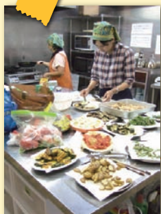
● 農園で育てた自慢の野菜でランチ提供