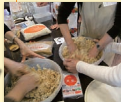
● 味噌づくりで日本の伝統食伝える