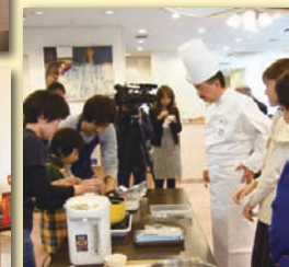
● スープコンテストに参加して腕を磨く。食のプロや一流シェフの審査を受けられるチャンス!