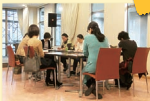
● 管理栄養士に学び、体質改善ランチに挑戦