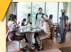
● お店を実際に開く前に1dayカフェで経験を積む