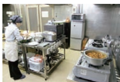
■ 厨房は少人数の調理実習も可能です。

■ 手ごろな広さの60席のホール。目的にあわせてレイアウトも自由自在。マイクやプロジェクターも完備。 *みんなのキッチンの利用は有料です。