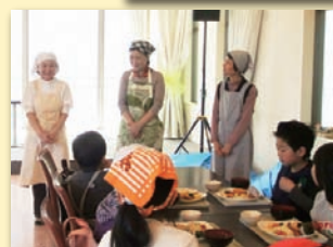
● 孫世代とふれあいながら食の大切さを伝える