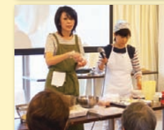
● 企業の商品デモの講師も。活躍の場が広がる!