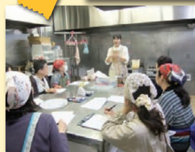
● 家庭でも実践できる薬膳講座を開く